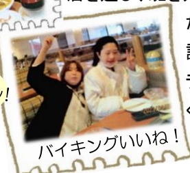
バイキングいいね！