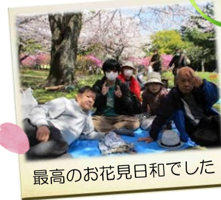
最高のお花見日和でした

お昼は毎日食堂の特注弁当♪食べきれないほどのごちそうで、皆さん大満足でした。5月は森林浴を予定しています。