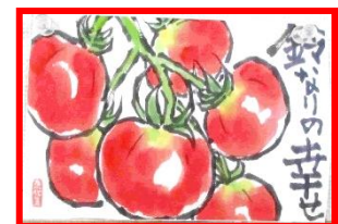
絵手紙教室の作品です！