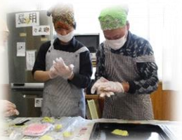
畑のおいもで作ったよ